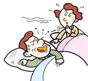
眠っている間に呼吸が止まる